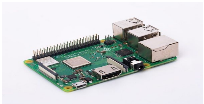
Raspberry Pi 3 嵌入式實作平台