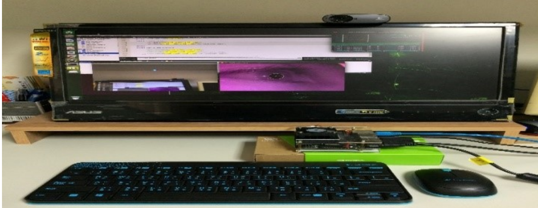
駕駛行為狀態偵測平台(需 Webcam、螢幕、嵌入式平台;包含眼動儀功能)