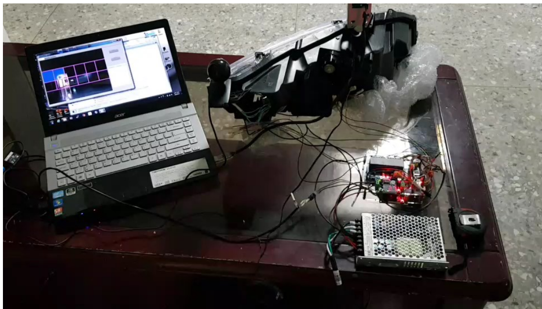
智慧車燈實作平台(需電腦/螢幕、Webcam、車燈機構、車燈控制模組)