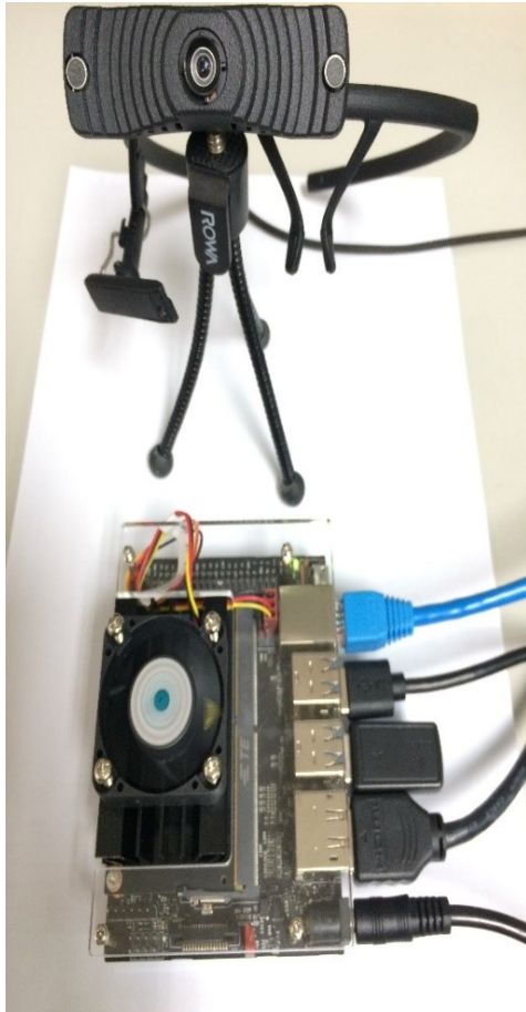
NVIDIA Nano 嵌入式實作平台